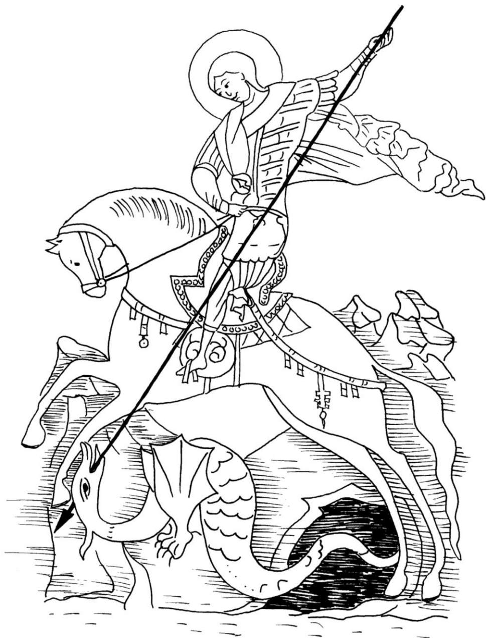
Dětské okénko připravila Alžběta Brodániová. Kresba je překreslena z knihy "Křesťanské nebe" (autorka: Helena Florentová, ilustrace Vladimír Kopecký, nakladatelství Artia a.s. a Granit s.r.o., 1994)