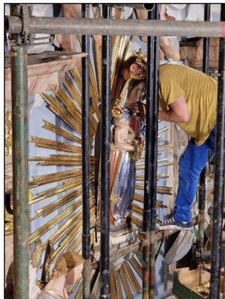
Zrestaurované retabulum (2024)