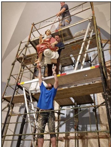
Instalace retabula (2024)