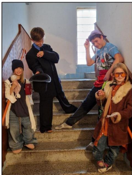
Odjezd na mikrochaloupku (2024)