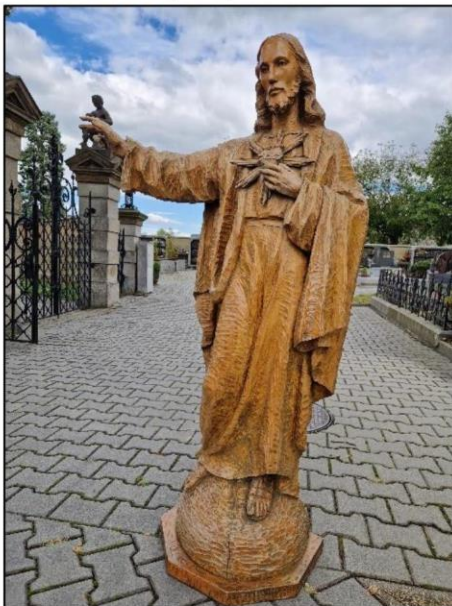
Odvoz sochy Božského Srdce Ježíšova k restaurování (2024)