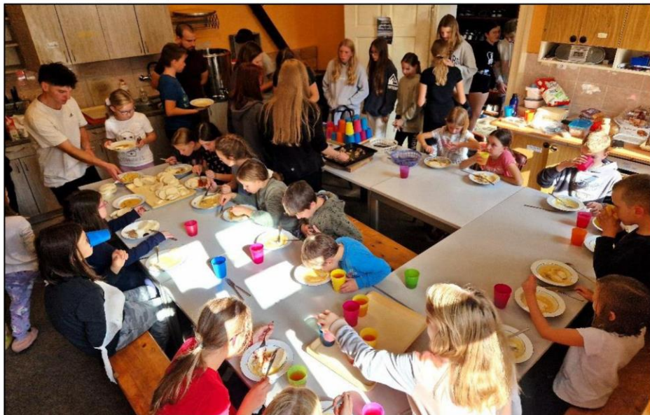
Poděkování za úrodu (2024)