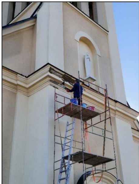
Oprava římsy kostela (2024)